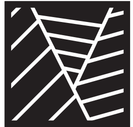
④線の向きを変えながらくり返します。