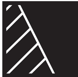
②区切った一方にたくさん線をほります。