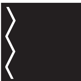
①ジグザグ線をほります。