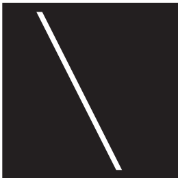
①直線で区切ります。