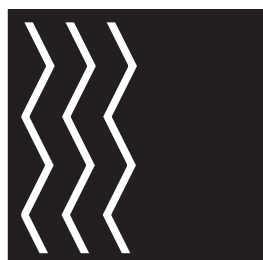
②ジグザグ線を横に並べながらほっていきます。