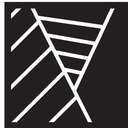
③もう一方をさらに区切り線をたくさんほります。