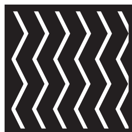
③たくさん並べます。